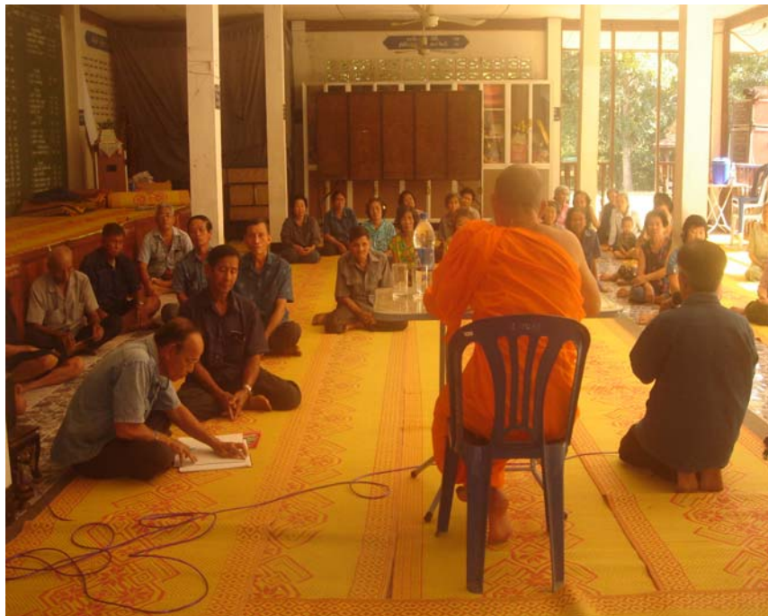
พระสงฆ์ให้การสนับสนุนส่งเสริมในกิจกรรมต่างๆของชุมชนอย่างสม่ำเสมอ